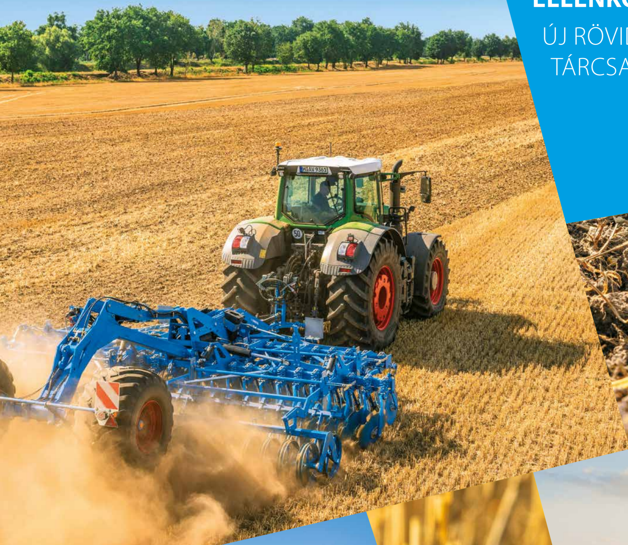
RUBIN 10 KUA