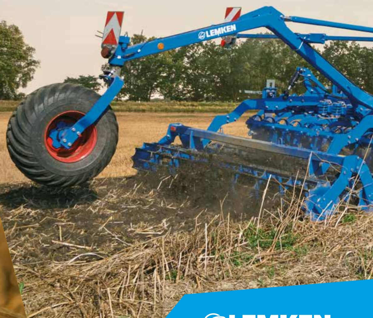
RUBIN 10 U