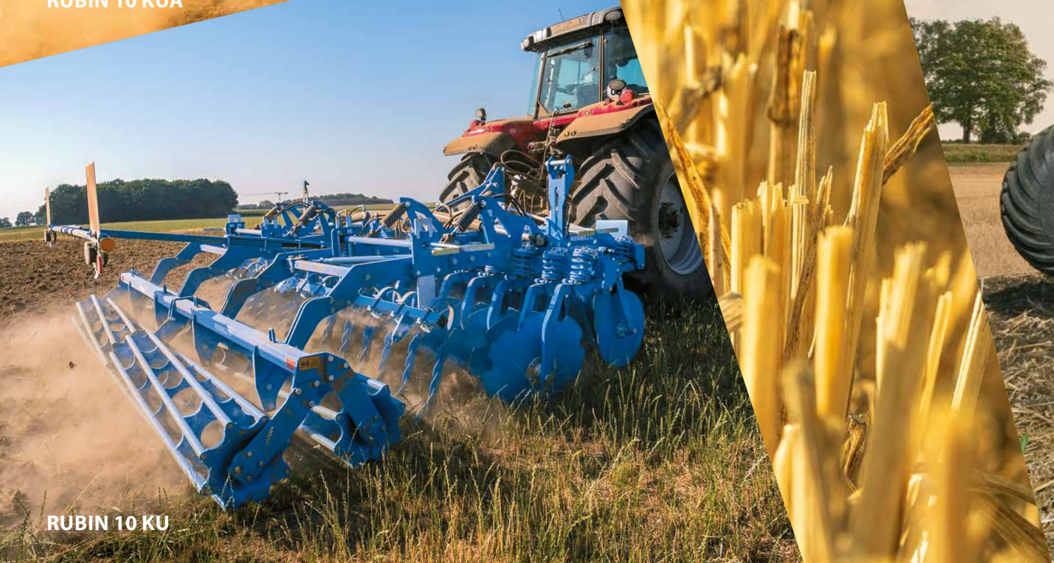
RUBIN 10 KU