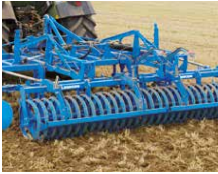
MSW 600 késes henger

A késes henger 125 mm osztással elhelyezett gyűrűkből áll.