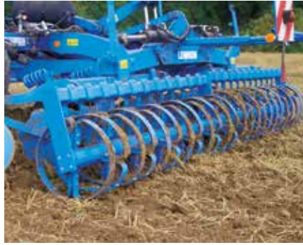
FRW 540 rugós-gyűrűs henger

A rugós acél gyűrűtagok csökkentett gördülő hatása miatt a rugós-gyűrűs henger különösen alkalmas nedves, kötött talajokra, melyek hajlamosak a ragadásra. A henger tömege ideális a függesztett munkagépek számára.