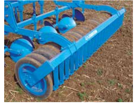
GRW 590 gumigyűrűs henger

A gumi-gyűrűs henger különálló, 125 mm osztással elhelyezett gumi gyűrűkből áll. A henger használható 125 mm sortávolságú vetőgépekkel, a talajnak a sorok előtti megtömörítésére.