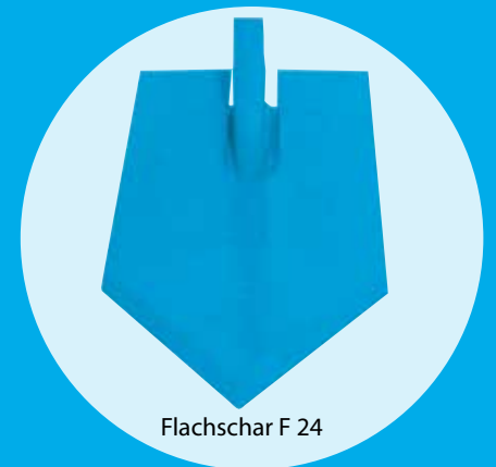
Flachschar F 24

In der Grundausrüstung ist der Topas mit Wechsel-Flügelscharen ausgestattet. Spitze, Leitblech und Flügelschare sind durch einen Scharfuß verbunden und somit separat, das heißt kostengünstig, austauschbar. Zur gezielten, tieferen Lockerung ohne Mischwirkung kann der Topas auch mit Flachscharen ausgerüstet werden.